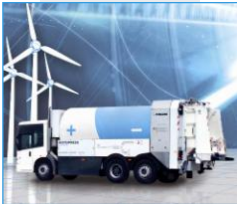
FAUN KIRCHHOFF Group