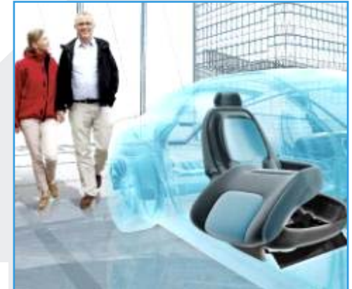
REHA Group Automotive